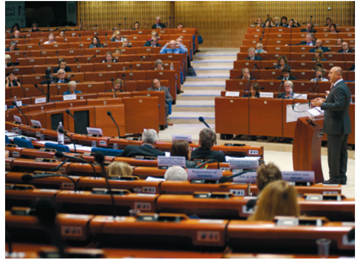
Intervención de uno de los ponentes ante el Congreso.

Durante la Sesión del CPLRE se analizaron diversos informes sobre el estado de la democracia local y regional en Eslovenia,