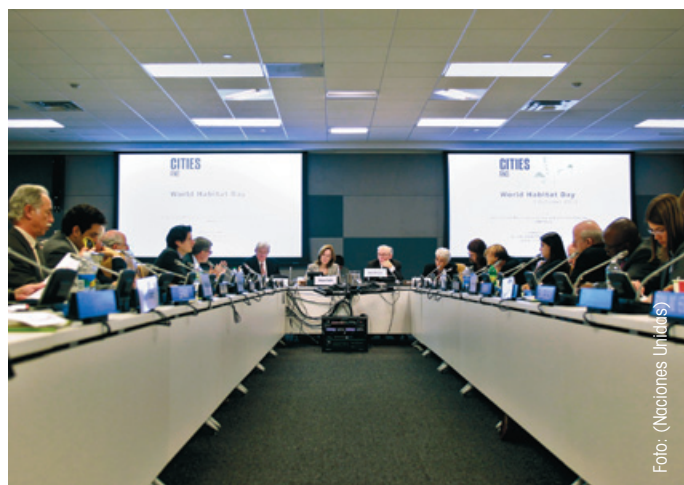
Encuentro celebrado en Naciones Unidas, el 3 de octubre, bajo el lema “Ciudades y cambio climático”.