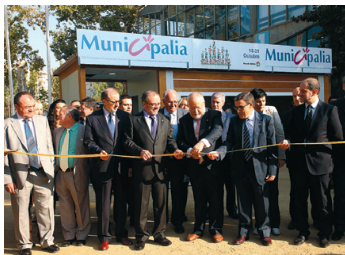
El Presidente de la Diputación de Barcelona corta la cinta en el acto inaugural de MuniCipalia.

El Alcalde de Lleida, también presente en la apertura, demandó una normativa financiera local porque "los Ayuntamientos necesitan una Ley de Financiación Local para continuar con nuestra contribución al mantenimiento del estado del bienestar" . A pesar de la crisis y de la disminución de los ingresos "los Ayuntamientos tenemos como prioridad la atención social, aunque para ello hemos de recurrir al endeudamiento" , dijo. Para el Alcalde anfitrión, es básica la cooperación entre todos los Entes Locales con la mancomunidad de servicios y, "si es necesario, tendremos que reducir Administraciones y no crear nuevos niveles" . Añadió que "los Ayuntamientos debemos tener la capacidad de promover la economía y crear ocupación en el entorno geográfico donde trabajamos, ya sea impulsando viveros de empresas, parques tecnológicos o entes turísticos" , y recordó que en la 16 edición, MuniCipalia se prestaba especial atención a la aplicación de nuevas tecnologías en los equipamientos y servicios municipales para reducir costes y conseguir eficacia energética; de hecho, buena parte de las jornadas y encuentros celebrados en la feria giraron