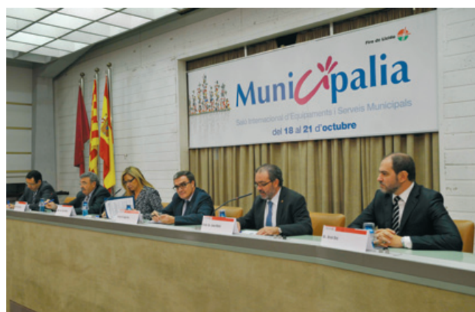
Acto de clausura de la 16 Edición de MuniCipalia.

El debate financiero se prolongó durante la celebración de la feria en el marco de jornadas y actos organizados en el transcurso de MuniCipalia. Al finalizar, en el acto de clausura, la Vicepresidenta de la Generalitat también se refirió a esta cuestión y señaló que el Gobierno de Cataluña trabaja actualmente en la elabo-