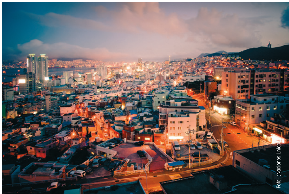
Imagen de Busan, la segunda ciudad más grande de Corea y una de las más populosas.

El cambio climático y la sostenibilidad no han de abordarse desde una perspectiva exclusivamente medioambiental; el trabajo que desempeñan a diario los responsables de ciudades y territorios tanto en ese ámbito como en relativo al desarrollo, la cultura, o la seguridad han de formar parte de una estrategia amplia para abordar el futuro. Así lo manifestaron los representantes de la organización municipalista mundial Ciudades y Gobiernos Locales Unidos, CGLU, el pasado 3 de octubre, Jornada Mundial del Hábitat 2011, conmemorada bajo el lema "Ciudades y cambio climático".