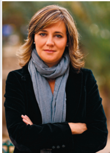
Elena Bastidas, Alcaldesa de Alzira, repite como Presidenta de la Federación Valenciana de Municipios y Provincias.