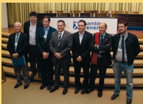
Comité Ejecutivo de la FEMP-Castilla-La Mancha