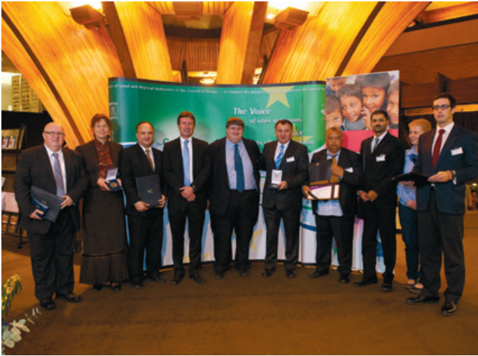
Los agradecidos con los Premios Dosta posan con el Presidente Whitmore.

del Consejo de Europa que eliminen las reservas o declaraciones planteadas ante la ratificación de la Carta, y otro que propone un conjunto de medidas destinadas a incorporar el contenido de la misma en el ordenamiento jurídico interno de los Estados miembros.