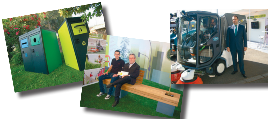
En Municipalia tuvieron cabida todas las novedades en materia de servicios y equipamientos municipales.

ración de una Ley de Gobiernos Locales y en otra de Finanzas Locales que vengán a definir qué Administraciones han de asumir cada competencia y qué recursos han de asignarse para ello a cada una. Se refirió también a los contactos establecidos entre el Gobierno catalán y el central de cara a obtener una moratoria en la liquidación de la PIE de 2008 y 2009 y anunció que espera que una vez constituido el Consejo de Gobiernos Locales, se pida al Gobierno este aplazamiento que supone un total de 790 millones de euros -215 correspondientes a 2008 y 575 a 2009-. Sobre la deuda de la Generalitat con los Consistorios, explicó que se afrontaría con la máxima agilidad posible.