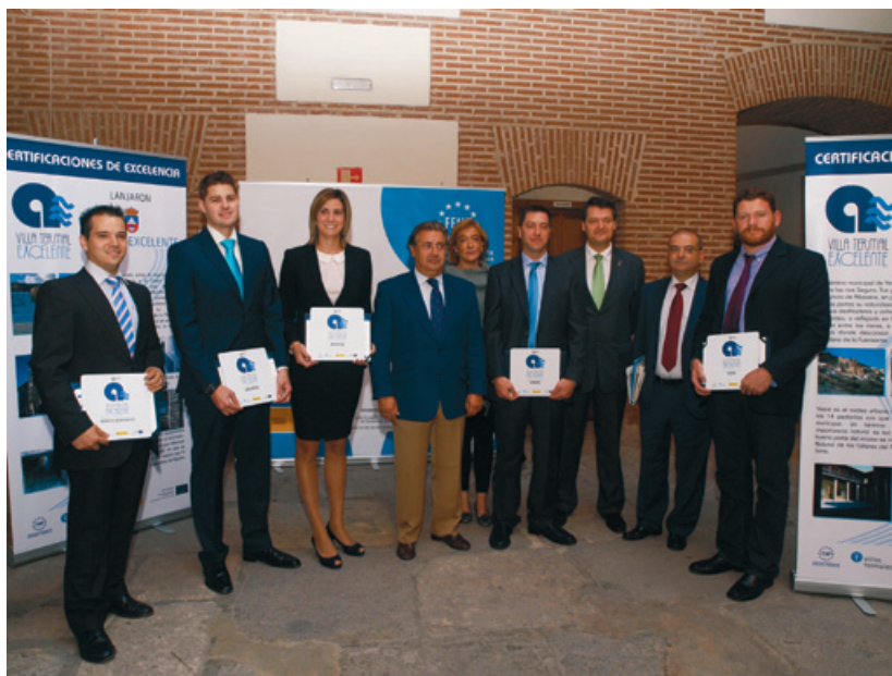
El Presidente de la FEMP, Juan Ignacio Zoido, posa con los Alcaldes y Concejales de los municipios distinguidos.

Los municipios de Archena (Murcia), Jaraba (Zaragoza), Lanjarón (Granada), Yeste (Albacete) y Baños de Montemayor (Cáceres) destacan por el elevado nivel de calidad de los servicios que ofrecen como Entidades Locales que disponen en su territorio de una instalación balnearia con aguas minero medicinales. Por eso han obtenido la mención de Villa Termal Excelente , una distinción que les fue entregada por el Presidente de la FEMP en un acto celebrado en la sede de esta Federación.