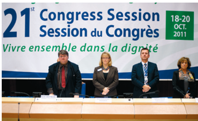
Apertura de la Sesión. A la izquierda, el Presidente del CPLRE, Keith Withmore.

CPLRE a la campaña “UNO sobre CINCO” del Consejo de Europa, cuyo principal objetivo es promover la Convención de Lanzarote –instrumento jurídico de referencia en este ámbito- y sensibilizar a todos los actores, incluidos los propios niños, sobre la gravedad de este tipo de violencia y sobre las acciones que pueden emprenderse para prevenirla. El trabajo del CPLRE busca, sobre todo, animar a las Autoridades Territoriales a desarrollar estructuras y mecanismos multidisciplinares y a promover una cultura de ciudades y regiones más adaptada a los niños.