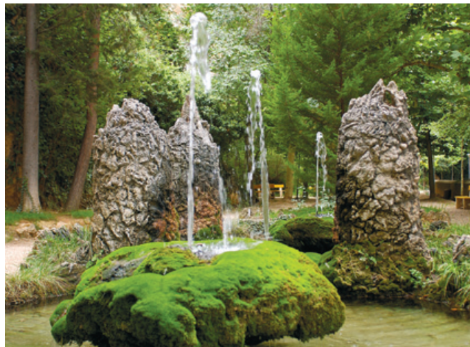
Instalaciones del balneario de Jaraba.

El entorno de Jaraba cuenta con atractivos parajes naturales que congregan a multitud de visitantes atraídos no sólo por las aguas termales, sino también por la práctica de actividades deportivas en el Cañón del Río Mesa y el embalse de la Tranquera, o la cercanía del sobradamente conocido Monasterio de Piedra. El Ayuntamiento de Jaraba ha realizado un intenso trabajo de recuperación de itinerarios naturales, que facilitan el acceso a los parajes de mayor interés ambiental para contemplar, por ejemplo, sabinas negrales y pinos carrascos que se alternan con el bosque de ribera compuesto de sauces, álamos y fresnos. En los farallones de piedra que se alzan a ambos lados del cauce de los ríos, tiene su hábitat una importante fauna avícola, con una de las colonias de buitres leonados más importantes de la Península Ibérica. Es fácil también contemplar ejemplares de alimoche, halcón peregrino, búho real y águilas.