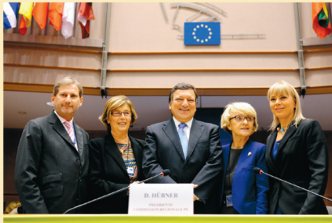
En el centro, el Presidente de la Comisión, junto al resto de las autoridades, en el acto de apertura de los Open Days.

Otro de los foros de la Semana Europea de la Regiones y las Ciudades fue el Punto de Encuentro, ubicado en las instalaciones del Comité de las Regiones. En este foro se presentaron 65 estudios de casos de asociaciones público-privadas de 19 países y diferentes sectores, desde tecnologías de la información hasta desarrollo urbano, en el marco de seminarios y sesiones en red con la participación de expertos, Autoridades Regionales y Locales, instituciones financieras y empresas privadas.