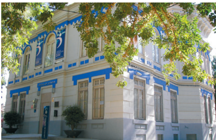
Villa termal de Archena.

El manantial de agua termal que aflora a escasos dos kilómetros del núcleo urbano es la referencia fundamental del municipio de Archena y, probablemente, el elemento con el que más se la identifica en el exterior. Las propiedades curativas de sus aguas, ya utilizadas por íberos y romanos, hicieron que Archena fuese, con mucho, el balneario más visitado de España a finales del siglo XIX. La afluencia de visitantes, que con frecuencia se hospedaban en las casas de los propios vecinos, le ha conferido a la Villa su carácter abierto y ha permitido que el turismo termal, cuando aún no se conocía ese concepto, fuese un complemento de la economía basada en su riqueza agrícola. Las profundas transformaciones de los últimos cincuenta años y la cada vez más notoria importancia que el termalismo ha adquirido en España en la última década, han convertido a Archena en un centro turístico y de servicios, desplazando a la agricultura como fuente principal de trabajo y riqueza.