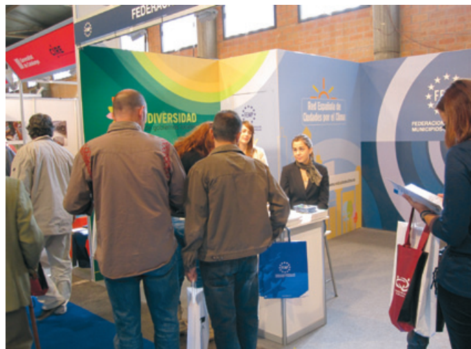
Varios visitantes son atendidos en el stand de la FEMP

Además de los visitantes brasileños participantes en esta iniciativa, el resto de los casi 22.000 visitantes de Municipalia pudieron conocer en esta edición las novedades y propuestas de los expositores que mostraron sus productos en los stands, uno de ellos fue el de la FEMP, ubicado en la zona de exposición de las instituciones ★