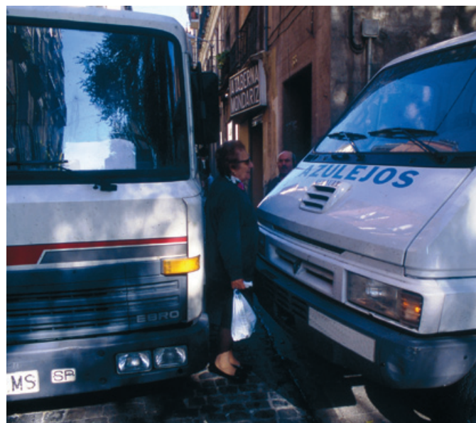
El incumplimiento cívico es otro de los factores que impiden la accesibilidad.

Los redactores del estudio, en sus conclusiones, apuntan como primer elemento de reflexión que actualmente se tiende a actuar sobre determinados elementos de accesibilidad, que incluso se están convirtiendo en iconos, sin afrontar un “abordaje universal” del problema. Ponen un ejemplo: hay un avance importante en la colocación de vados en las calles, mientras sigue siendo imposible acceder a la gran mayoría de los locales comerciales.