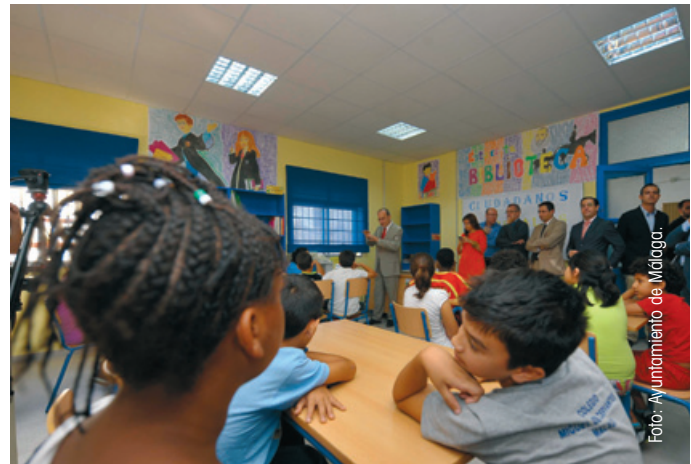
El Alcalde de Málaga, al fondo, durante la visita a un colegio con motivo de la SEDL, el pasado octubre.

Reuniones y debates del Alcalde con universitarios o con movimientos asociativos, encuentros en colegios, jornadas de puertas abiertas en museos y servicios públicos municipales para que los ciudadanos pudieran visitar el patrimonio artístico y natural de la ciudad y conocer mejor las funciones de los servicios públicos,