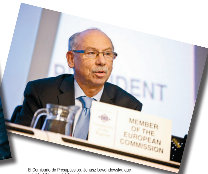
El Comisario de Presupuestos, Janusz Lewandowsky, que asistió al Plenario del Comité.