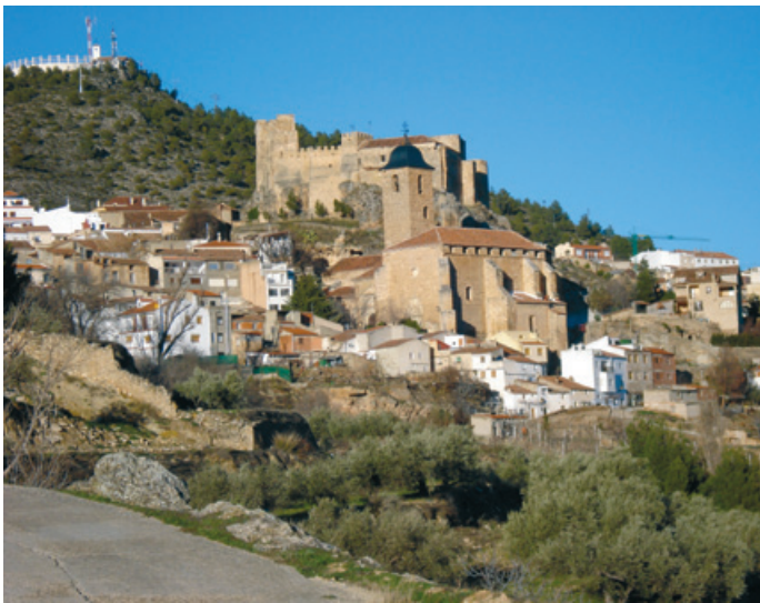
Vista general de Yeste. A la derecha, terma romana en Baños de Montemayor.

Yeste (Albacete) es el núcleo urbano más importante de las 14 pedanías con que cuenta su término municipal, buena parte del mismo integrado en el Parque Natural de los Calares del Río Mundo y de la Sima. Una estrecha carretera local flanqueada por una bellísima y frondosa naturaleza, conduce, tras 13 kilómetros de recorrido, al balneario de Tus, asentado en la ribera del río que le da nombre, en el profundo valle horadado por el discurrir del agua a través de los siglos. A pesar de lo escondido del lugar, las aguas termales que brotan en este privilegiado rincón eran ya utilizadas por los romanos. En la actualidad es un establecimiento moderno que cada año renueva instalaciones.