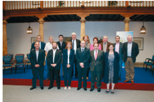
Nueva Comisión Ejecutiva de la Federación Asturiana de Concejos.