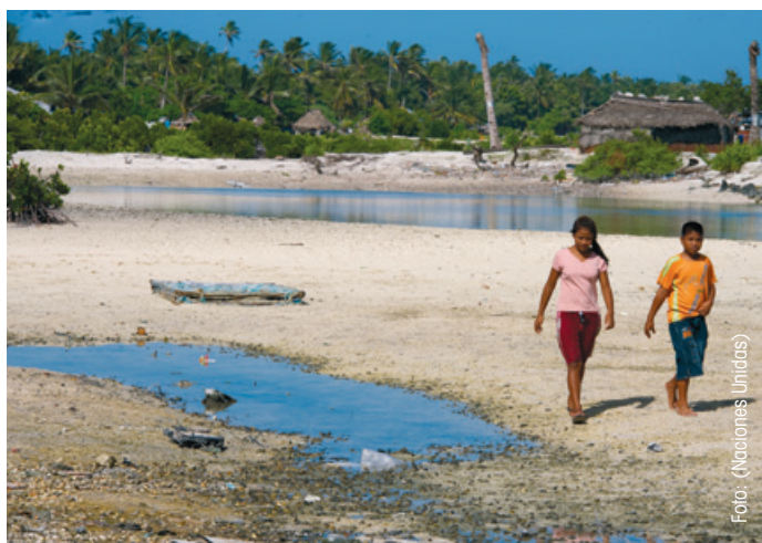
Emplazamiento en la isla-nación de Kiribati, en el Océano Pacífico, afectada por el cambio climático

Finalmente, en relación con el cuarto de los pilares, “hacer ciudades con capacidad de adaptación (“resilientes”), serán los Gobiernos Locales los que, a juicio de CGLU, podrán conseguirlo: “Estamos convencidos de que una acción preventiva coordinada y anticipada, que no tenga en cuenta costes de inversión será capaz de reducir drásticamente los costes humanos y financieros. Serán necesarios programas de formación y capacitación en el nivel local de cara a apoyar los riesgos e la integración urbana en las estrategias locales y garantizando terrenos seguros e infraestructuras para la población pobre” . Las estrategias de reducción de riesgos de desastre han de considerarse –subraya CGLU– como una inversión y no como un gasto en los niveles nacional y local ★